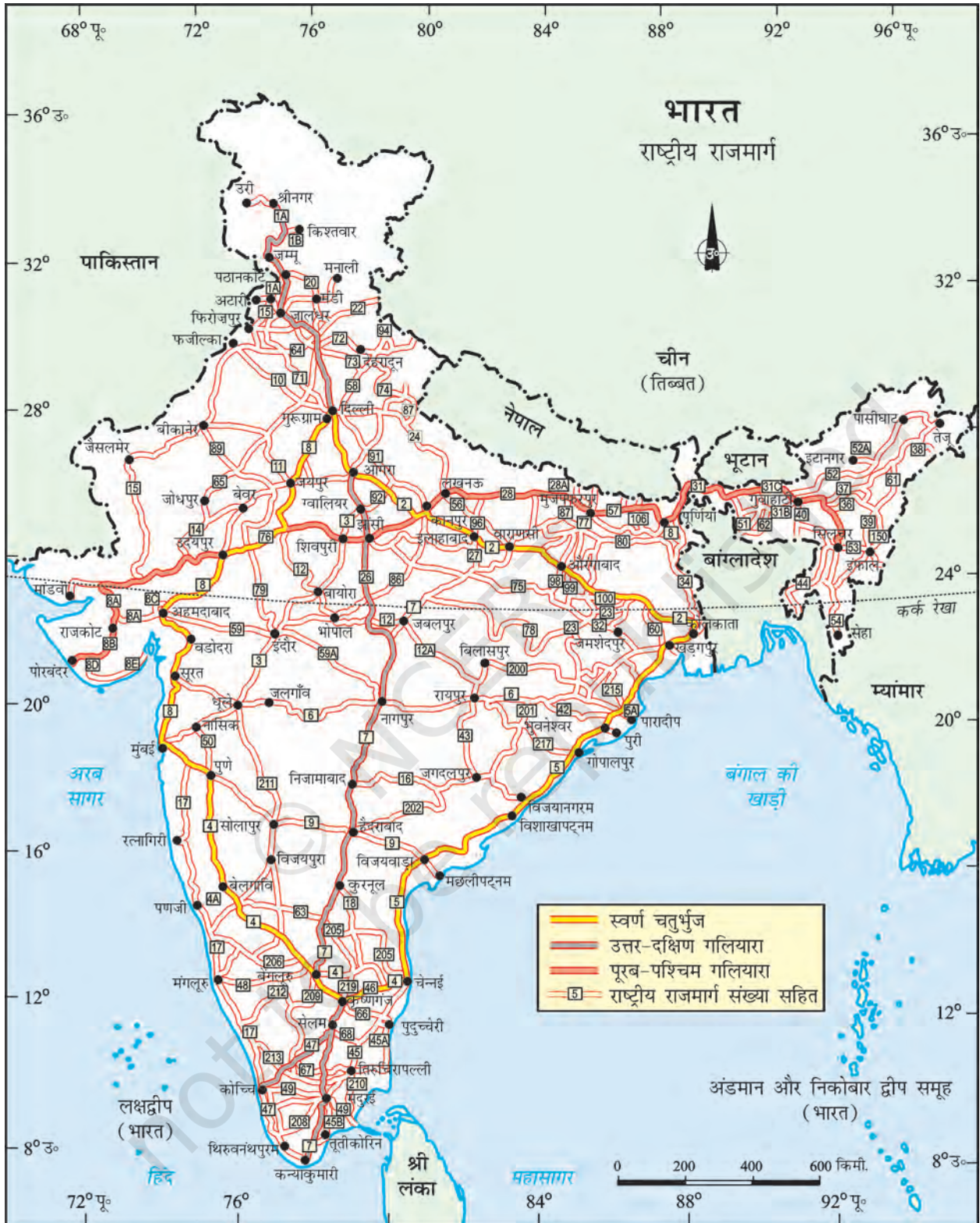
भारत - राष्ट्रीय राजमार्ग