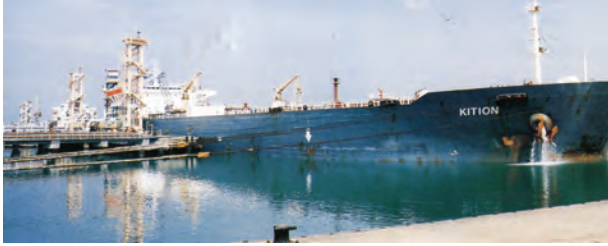
चित्र 7.7 – न्यू-मंगलौर पत्तन पर टैंकर द्वारा कच्चे तेल का निर्वहन

पत्तन की सुविधा भी प्रदान कर सके। लौह-अयस्क के निर्यात के संदर्भ में मारमागाओ पत्तन देश का महत्वपूर्ण पत्तन है। यहाँ से देश के कुल निर्यात का आधा (50 प्रतिशत) लौह-अयस्क निर्यात किया जाता है। कर्नाटक में स्थित न्यू-मैंगलोर पत्तन कुद्रेमुख खानों से निकले लौह-अयस्क का निर्यात करता है। सुदूर दक्षिण-पश्चिम में कोची पत्तन है; यह एक लैगून के मुहाने पर स्थित एक प्राकृतिक पोताश्रय है।