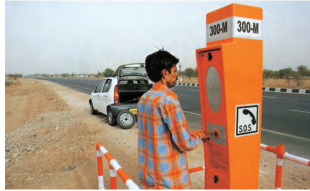
चित्र 7.10 – राष्ट्रीय राजमार्ग-8 पर एक आपातकालीन कॉल बॉक्स

डिजिटल भारत एक ज्ञान आधारित परिवर्तन के लिए, भारत को तैयार करने के लिए एक विशाल कार्यक्रम है। डिजिटल भारत कार्यक्रम का मुख्य उद्देश्य IT (भारतीय प्रतिभा) +IT (सूचना प्रौद्योगिकी)=IT (कल का भारत) में होने वाले परिवर्तन को समझना है और तकनीक को केन्द्र में रखकर बदलाव लाना है।