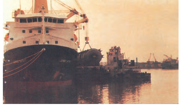
चित्र 7.8 – बड़े आकार के कार्गो को उठाने-रखने की सुविधाओं से युक्त तूतीकोरन पत्तन

पूर्वी तट के साथ तमिलनाडु में दक्षिण-पूर्वी छोर पर तूतीकोरन पत्तन है। यह एक प्राकृतिक पोताश्रय है तथा इसकी पृष्ठभूमि भी अत्यंत समृद्ध है। अतः यह पत्तन हमारे पड़ोसी देशों जैसे – श्रीलंका, मालदीव आदि तथा भारत के तटीय क्षेत्रों की भिन्न वस्तुओं के व्यापार को संचालित करता है। चेन्नई हमारे देश का प्राचीनतम कृत्रिम पत्तन है। व्यापार की मात्रा तथा लदे सामान के संदर्भ में इसका मुंबई के बाद दूसरा स्थान है। विशाखापट्टनम स्थल से घिरा, गहरा व सुरक्षित पत्तन है। प्रारम्भ में यह पत्तन लौह-अयस्क निर्यातक के रूप में विकसित किया गया था। ओडिशा में स्थित पारादीप पत्तन विशेषतः लौह-अयस्क का निर्यात करता है। कोलकाता एक अंतःस्थलीय नदीय (Riverine) पत्तन है। यह पत्तन गंगा-ब्रह्मपुत्र बेसिन के वृहत् व समृद्ध पृष्ठभूमि को सेवाएँ प्रदान करता है। ज्वारीय (Tidal) पत्तन होने के कारण तथा हुगली के तलछट जमाव से इसे नियमित रूप से साफ करना पड़ता है। कोलकाता पत्तन पर बढ़ते व्यापार को कम करने हेतु हल्दिया सहायक पत्तन के रूप में विकसित किया गया है।