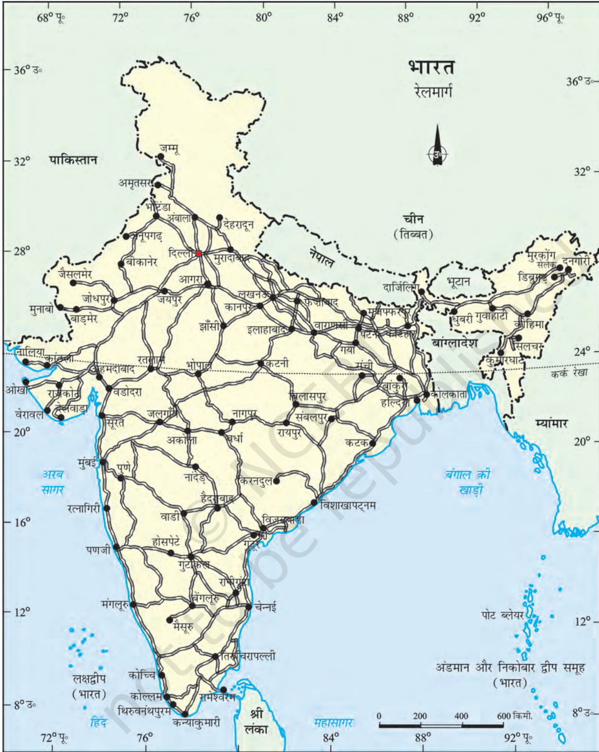
भारत - रेलमार्ग