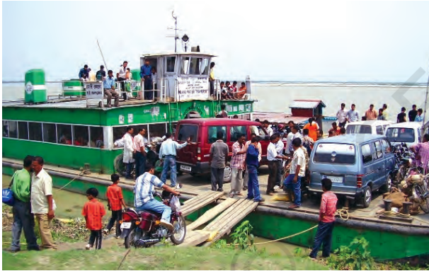
चित्र 7.5 – उत्तर-पूर्वी राज्यों में आंतरिक जलमार्ग परिवहन अधिक महत्वपूर्ण है

भारत के लोग प्राचीनकाल से समुद्री यात्राएँ करते रहे हैं। इसके नाविकों ने दूर तथा पास के क्षेत्रों में भारतीय संस्कृति व व्यापार को फैलाया है। जल परिवहन, परिवहन का सबसे सस्ता साधन है। यह भारी व स्थूलकाय वस्तुएँ ढोने में अनुकूल है। यह परिवहन साधनों में ऊर्जा सक्षम तथा पर्यावरण अनुकूल है। भारत में अंतः स्थलीय नौसंचालन जलमार्ग 14,500 किमी. लंबा है। इसमें केवल 5,685 किमी. मार्ग ही मशीनीकृत नौकाओं द्वारा तय किया जाता है।