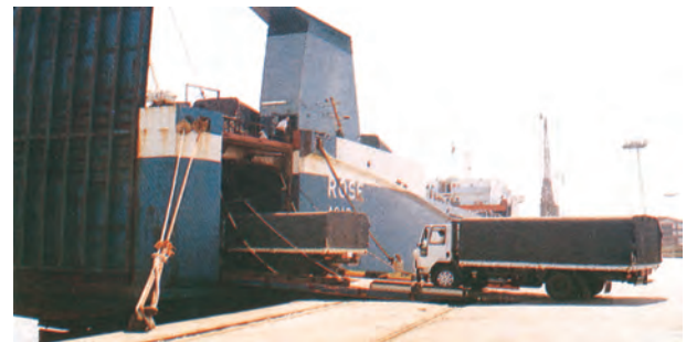
चित्र 7.6 – मुंबई पत्तन में जहाज पर ट्रकों को ले जाते हुए

मुंबई वृहत्तम पत्तन है जिसके प्राकृतिक खुले, विस्तृत व सुचारु पोताश्रय हैं। मुंबई पत्तन के अधिक परिवहन को ध्यान में रखकर इसके सामने जवाहरलाल नेहरू पत्तन विकसित किया गया जो इस पूरे क्षेत्र को एक समूह