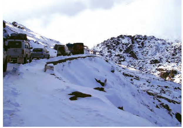
चित्र 7.4 – उत्तरी-पूर्वी सीमा सड़क पर यातायात (अरुणाचल प्रदेश)

सड़क निर्माण में प्रयुक्त पदार्थ के आधार पर भी सड़कों को कच्ची व पक्की सड़कों में वर्गीकृत किया जाता है। पक्की सड़कें, सीमेंट, कंक्रीट व तारकोल द्वारा निर्मित होती हैं, अतः ये बारहमासी सड़कें हैं। कच्ची सड़कें वर्षा ऋतु में अनुपयोगी हो जाती हैं।