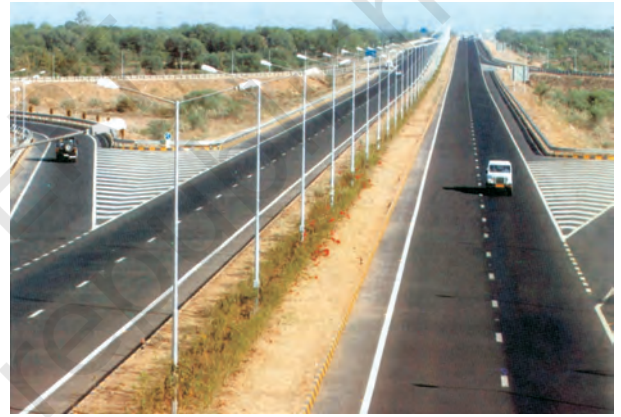
चित्र 7.1 – अहमदाबाद-वडोदरा द्रुतमार्ग