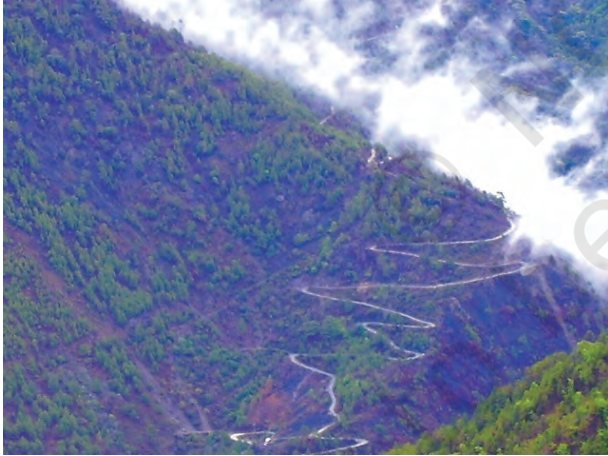
चित्र 7.3 – पहाड़ी रास्ते

सड़क निर्माण में प्रयुक्त पदार्थ के आधार पर भी सड़कों को कच्ची व पक्की सड़कों में वर्गीकृत किया जाता है। पक्की सड़कें, सीमेंट, कंक्रीट व तारकोल द्वारा निर्मित होती हैं, अतः ये बारहमासी सड़कें हैं। कच्ची सड़कें वर्षा ऋतु में अनुपयोगी हो जाती हैं।