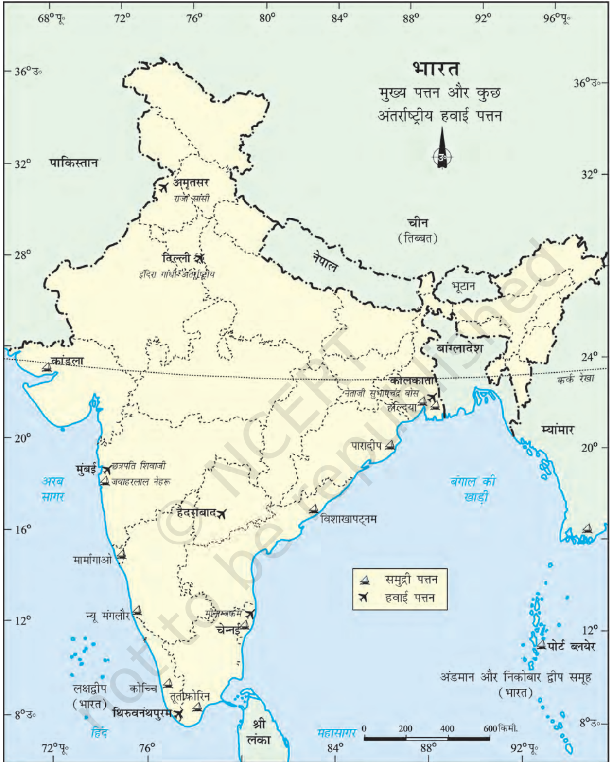
भारत - मुख्य पत्तन और कुछ अंतर्राष्ट्रीय हवाई पत्तन