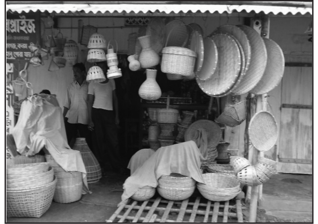
شکل 6.3 : آسام میں کثیر صنعتوں کی مصنوعات بازار میں برائے فروخت

چھوٹے پیمانے کی صنعتیں گھریلو صنعتوں سے اپنی پیداوار تکنیکی اور بنانے کی جگہ (گھر/ پیداواری رہائش سے باہر ورکشاپ) کے اعتبار سے ممتاز ہوتی ہیں۔ اس قسم کی صنعتوں میں مقامی کچے مال، توانائی سے چلنے والی معمولی مشینیں اور نیم ماہر کاریگروں کا استعمال کیا جاتا ہے۔ یہ صنعتیں روزگار مہیا کرتی ہیں اور مقامی قوت خرید کو بڑھاتی ہیں۔ اس لیے ہندوستان، چین، انڈونیشیا اور برازیل وغیرہ جیسے ممالک نے مزدوروں پر منحصر چھوٹے پیمانے کی صنعتوں کو فروغ دیا ہے تاکہ اپنی آبادی کو ملازمت فراہم کر سکیں۔