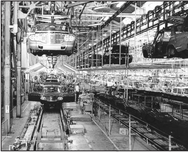
شکل 6.4 : جاپان میں موٹر کمپنی کے ایک کارخانے میں اسمبلی لائن پر مسافر کاروں کا بنانا