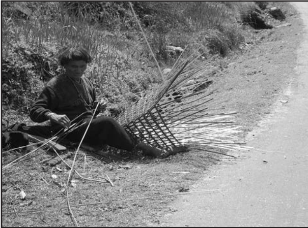
شکل 6.2 (b): اروناچل پردیش میں ایک آدمی سڑک کے کنارے بانس کی ٹوکری بناتا ہوا۔