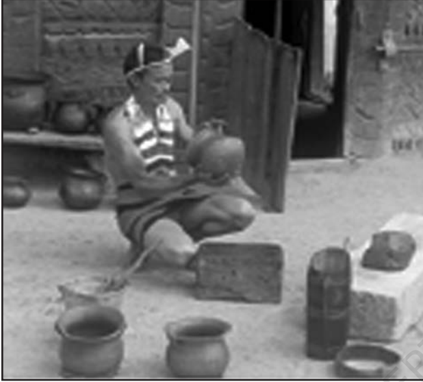
شکل 6.2 (a): ایک آدمی اپنے آنگن میں برتن بناتا ہوا۔ ناگ لینڈ میں گھریلو صنعت کی ایک مثال

بازار میں فروخت کیا جاتا ہے یا جنس کے بدلے میں فروخت ہوتا ہے۔ اس قسم کی صنعت پر سرمایہ اور نقل و حمل کا کوئی زیادہ اثر نہیں ہوتا کیوں کہ اس قسم کی صنعت تجارتی طور پر کم اہمیت کی حامل ہوتی ہے اور زیادہ تر اوزار مقامی طور پر تیار کر لیے جاتے ہیں۔