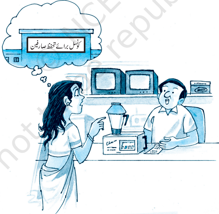
صارفین کی بیداری

3- صارفین کی بیداری (Consumer Awareness): اگر صارفین اپنے حقوق اور ان سہولتوں سے باخبر ہوں گے جو قانون نے انہیں دے رکھی ہیں تو وہ ہر قسم کی تجارتی بدعنوانی، بے ایمانی اور استحصال کے خلاف آواز اٹھا سکیں گے۔ اس کے علاوہ اگر صارفین کو اپنی ذمہ داریوں کا شعور اور احساس ہوگا تو وہ اپنے مفادات کی بھی حفاظت کر سکیں گے۔