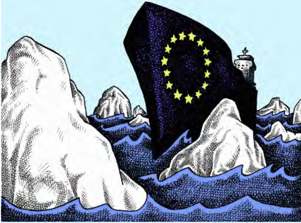
एंस, केगल्स कार्टून

2003 में यूरोपीय संघ ने एक साझा संविधान बनाने की कोशिश की थी। यह कोशिश नाकामयाब रही। इसी को लक्ष्य करके यह कार्टून बना है। कार्टूनिस्ट ने यूरोपीय संघ को टाइटेनिक जहाज के रूप में क्यों दिखाया है?