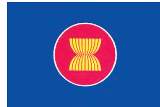
आसियान का झंडा

1967 में इस क्षेत्र के पाँच देशों ने बैंकॉक घोषणा पर हस्ताक्षर करके 'आसियान' की स्थापना की। ये देश थे इंडोनेशिया, मलेशिया, फिलिपींस, सिंगापुर और थाईलैंड। 'आसियान' का उद्देश्य मुख्य रूप से आर्थिक