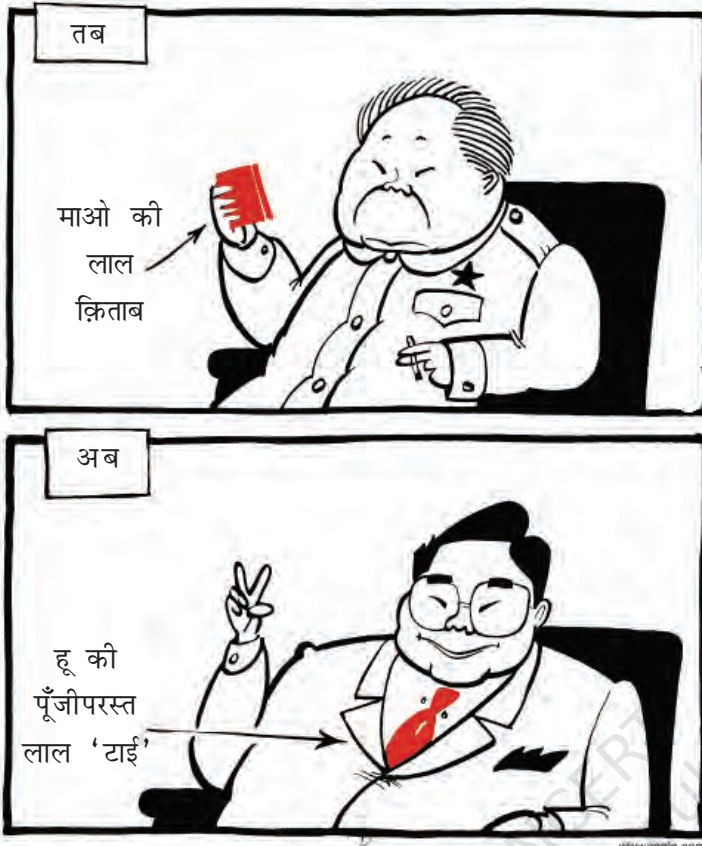
चीन : तब और अब