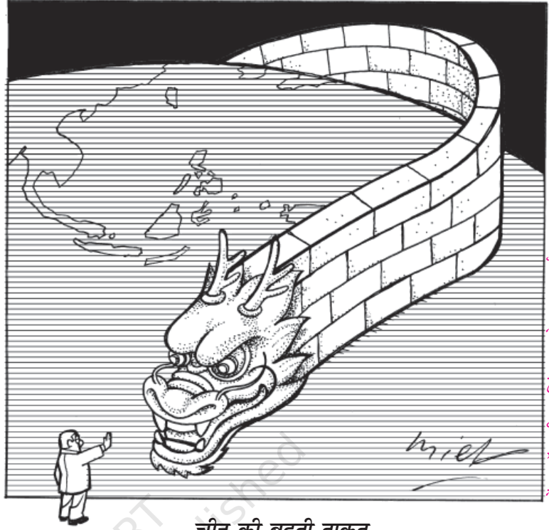
डेग काय मील, सिगापुर, केगल्स कार्टून

नयी आर्थिक नीतियों के कारण चीन की अर्थव्यवस्था को अपनी जड़ता से उबरने में मदद मिली। कृषि के निजीकरण के कारण कृषि-उत्पादों तथा ग्रामीण आय में उल्लेखनीय बढ़ोत्तरी हुई। ग्रामीण अर्थव्यवस्था में निजी बचत का परिमाण बढ़ा और इससे ग्रामीण उद्योगों की तादाद बड़ी तेजी से बढ़ी। उद्योग और कृषि दोनों ही क्षेत्रों में चीन की अर्थव्यवस्था की वृद्धि-दर तेज रही। व्यापार के नये कानून तथा विशेष आर्थिक क्षेत्रों (स्पेशल इकॉनामिक ज़ोन-SEZ) के निर्माण से विदेश-व्यापार में उल्लेखनीय वृद्धि हुई। चीन पूरे विश्व में प्रत्यक्ष विदेशी निवेश के लिए सबसे आकर्षक देश बनकर उभरा। चीन के पास विदेशी मुद्रा का अब विशाल भंडार है और इसके दम पर चीन दूसरे देशों में निवेश कर रहा है। चीन 2001 में विश्व व्यापार संगठन में शामिल हो