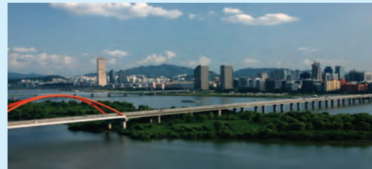
हान नदी के निकट सियोल का क्षितिज

इसी बीच दक्षिण कोरिया एशिया में सत्ता के केंद्र के रूप में उभरा। 1960 के दशक से 1980 के दशक के बीच, इसका आर्थिक शक्ति के रूप में तेजी से विकास हुआ, जिसे “हान नदी पर चमत्कार” कहा जाता है। अपने सर्वांगीण विकास को संकेतित करते हुए, दक्षिण कोरिया 1996 में ओईसीडी का सदस्य बन गया। 2017 में इसकी अर्थव्यवस्था दुनिया में ग्यारहवीं सबसे बड़ी अर्थव्यवस्था है और सैन्य खर्च में इसका दसवां स्थान है।