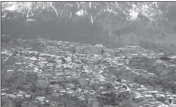
चित्र 4.1 : उत्तर-पूर्वी राज्यों में गुच्छित बस्तियाँ

गुच्छित ग्रामीण बस्ती घरों का एक संहत अथवा संकुलित रूप से निर्मित क्षेत्र होता है। इस प्रकार के गाँव में रहन-सहन का सामान्य क्षेत्र स्पष्ट और चारों ओर फैले खेतों, खलिहानों और चरागाहों से पृथक होता है। संकुलित निर्मित क्षेत्र और इसकी मध्यवर्ती गलियाँ कुछ जाने-पहचाने प्रारूप अथवा ज्यामितीय आकृतियाँ प्रस्तुत करते हैं जैसे कि आयताकार, अरीय, रैखिक इत्यादि। ऐसी बस्तियाँ प्रायः उपजाऊ जलोढ़ मैदानों और उत्तर-पूर्वी राज्यों में पाई जाती हैं। कई बार लोग सुरक्षा अथवा प्रतिरक्षा कारणों से संहत गाँवों में रहते हैं, जैसे कि मध्य भारत