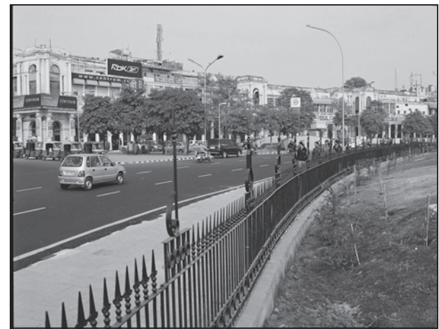
चित्र 4.4 : आधुनिक शहर का एक दृश्य

अंग्रेजों और अन्य यूरोपियों ने भारत में अनेक नगरों का विकास किया। तटीय स्थानों पर अपने पैर जमाते हुए उन्होंने सर्वप्रथम सूरत, दमन, गोआ, पांडिचेरी इत्यादि जैसे व्यापारिक पत्तन