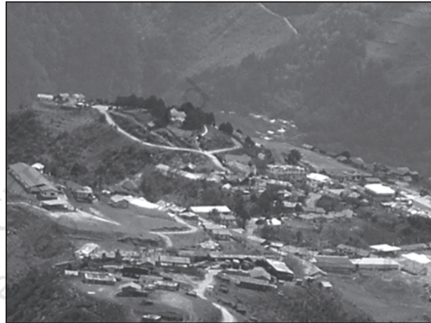
चित्र 4.2 : अर्ध-गुच्छित बस्तियाँ

अर्ध-गुच्छित अथवा विखंडित बस्तियाँ परिक्षिप्त बस्ती के किसी सीमित क्षेत्र में गुच्छित होने की प्रवृत्ति का परिणाम है। अधिकतर ऐसा प्रारूप किसी बड़े संहत गाँव के संपृथकन अथवा विखंडन के परिणामस्वरूप भी उत्पन्न हो सकता है। ऐसी स्थिति में ग्रामीण समाज के एक अथवा अधिक वर्ग स्वेच्छा से अथवा बलपूर्वक मुख्य गुच्छ अथवा गाँव से थोड़ी दूरी पर रहने लगते हैं। ऐसी स्थितियों में, आमतौर पर ज़मींदार और अन्य प्रमुख समुदाय मुख्य गाँव के केंद्रीय भाग पर