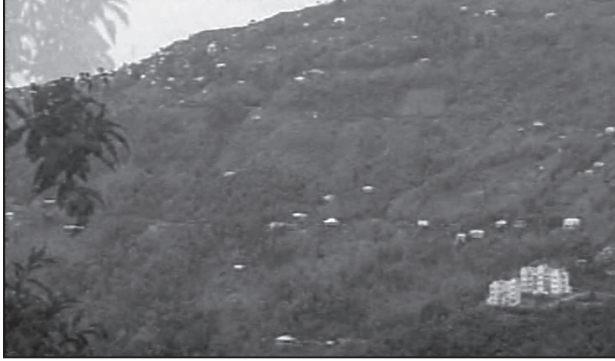
चित्र 4.3 : नागालैंड में परिक्षिप्त बस्तियाँ

भारत में परिक्षिप्त अथवा एकाकी बस्ती प्रारूप सुदूर जंगलों में एकाकी झोंपड़ियों अथवा कुछ झोंपड़ियों की पल्ली अथवा छोटी पहाड़ियों की ढालों पर खेतों अथवा चरागाहों के रूप में दिखाई पड़ता है। बस्ती का चरम विक्षेपण प्रायः भू-भाग और