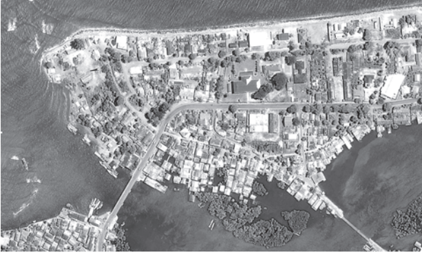
बंडा आसेह, जून 2004