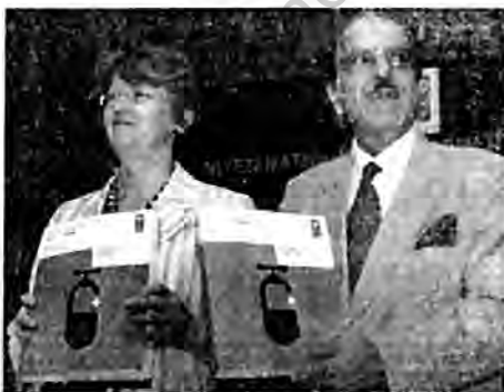
Water Resources Minister Saifuddin Soz (right) and Maxine Olson, UNDP Resident Representative in India, at the release of Human Development Report, 2006, in New Delhi on Thursday.

"The report focuses on water access this year as it cuts across all the MDGs," Olson said, adding that the MDG aimed at enabling each individual to get at least 20 litres of water a day. "India has a higher target of 40 litres a day," she said, referring to the target set by the Union Rural Development Ministry. The report, which was released by Water Resources Minister Saifuddin Soz, takes a hard look at the failure of irrigation systems in the country. Olson said that though agriculture has been blamed for consuming 80 per cent of water in India, the beneficiaries of the power subsidies are the rich farmers, while the poor still depend on rains. The report also notes that water harvesting, as well as the rise of canal irrigation and the groundwater revolution have led to neglect of traditional systems. Since the 1980s, the number of tanks, ponds and other surface water bodies has reduced by almost a third, thus reducing ground-