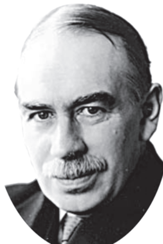
जॉन मेनार्ड कीन्स

ब्रिटिश अर्थशास्त्री जॉन मेनार्ड कीन्स का जन्म 1883 में हुआ था। उनकी शिक्षा किंग्स कॉलेज, कैंब्रिज यूनाइटेड किंगडम में हुई थी और बाद में 'विशेषज्ञ' के रूप में नियुक्त हुए। प्रथम विश्व युद्ध के वर्षों में वे तीक्ष्ण विद्वता के अलावा सक्रिय अंतर्राष्ट्रीय राजनायिक के रूप में भी जुड़े रहे। अपनी पुस्तक 'इकोनॉमिक कंसीक्वेसेज ऑफ द पीस' (1919) में युद्ध की शांति समझौते के भंग होने की भविष्याणी इन्होंने कर दी थी। उनकी पुस्तक 'जनरल थ्योरी ऑफ इंफ्लायमेंट, इंटरेस्ट एंड मनी' (1936) बीसवीं सदी की अर्थशास्त्र की महत्वपूर्ण पुस्तकों में से एक है। कीन्स विदेशी मुद्रा के समझदार सट्टेबाज थे।