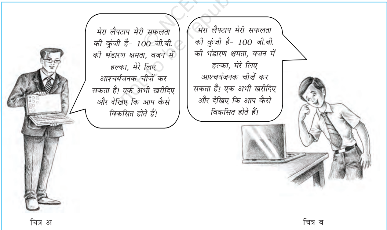
चित्र 6.1 कौन सा चित्र आपको एक लैपटॉप खरीदने के लिए अधिक व्यग्र करेगा- चित्र अ या चित्र ब? क्यों?

इन सबके अतिरिक्त, एक अभिवृत्ति प्रस्तुत सूचना की दिशा में या प्रस्तुत सूचना के विपरीत दिशा में परिवर्तित हो सकती है। दाँतों को ब्रश करने के महत्त्व का वर्णन करने वाला पोस्टर दंत-रक्षा के प्रति सकारात्मक अभिवृत्ति को प्रबल बनाएगा। परंतु यदि लोगों को दाँतों में भयावह गुहिका या छिद्र वाले चित्र दिखाए जाएँ तो वे इन चित्रों पर विश्वास नहीं करेंगे, और दंत-रक्षा के प्रति कम सकारात्मक हो जाएँगे। शोध में यह पाया गया है कि लोगों को समझाने में भय कभी-कभी बहुत अच्छी तरह से कार्य करता है, परंतु कोई संदेश यदि बहुत अधिक भय उत्पन्न करता है तो यह संग्राहक (reciever) को दूसरी दिशा में ले जाता है और इसका विश्वासोत्पादक प्रभाव भी कम हो जाता है।