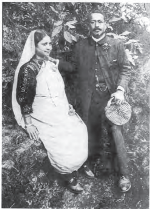
आधुनिकता एवं परंपरा का मिश्रण