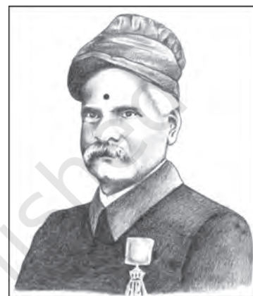
राजा रवि वर्मा

की नवीन प्रविधियों की उपस्थिति मिलती है जो कि तैलीय चित्र के रूप में व्यक्त होती है..... इसकी अन्य विशेषता है स्थानों के वितरण करने की प्रविधि जैसे उम्र और स्तरीकरण के अनुसार बैठे हुए व्यक्तियों की व्यवस्था, उससे 19वीं सदी के उन यूरोपीय चित्रों की याद आती है जिसमें बुर्जुवा परिवार दिखाए गए हैं। कितने आश्चर्य की बात है कि ये पेंटिंग मातृवंशीय केरल के नायकों की हैं जो कि कृष्णा मेनन की जाति थी, उस वक्त बनायी गई थीं जब वे पितृस्थानीय एकल परिवार से ज्यादा परिचित भी नहीं थे.....”