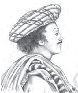
राजा राम मोहन राय