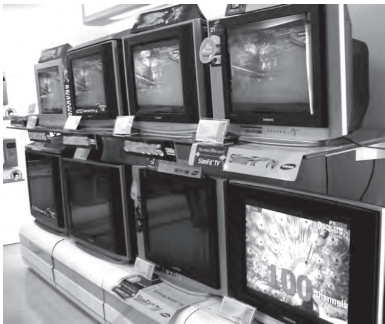
टेलीविज़न का शोरूम

1980 के दशक में, एक ओर जहाँ दूरदर्शन तेज़ी से विस्तृत हो रहा था, वहीं केबल टेलीविज़न उद्योग भी भारत के बड़े-बड़े शहरों में तेज़ी से पनपता जा रहा था। वी.सी.आर. ने दूरदर्शन की एकल चैनल कार्यक्रम व्यवस्था के अनेक विकल्प प्रस्तुत करके भारतीय दर्शकों के लिए मनोरंजन के विकल्पों में कई गुना वृद्धि कर दी। निजी घरों और सामुदायिक बैठक कक्षों में वीडियो कार्यक्रम देखने की सुविधा में भी तेज़ी से वृद्धि हुई। वीडियो कार्यक्रमों में अधिकतर देशी और आयातित दोनों प्रकार की फ़िल्मों पर आधारित मनोरंजन शामिल था। 1984 तक, मुंबई और अहमदाबाद जैसे नगरों में उद्यमी एक दिन में अनेक फ़िल्में प्रसारित करने के लिए अपार्टमेंट भवनों में तार लगाने लगे। केबल चलाने वालों की संख्या जो 1984 में 100 थी, बढ़कर 1988 में 1200, 1992 में 15,000 और 1999 में लगभग 60,000 हो गई।