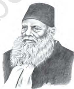
सर सैयद अहमद खाँ

आप जान चुके हैं कि उपनिवेशवाद ने हमारे जीवन पर दूरगामी प्रभाव डाले। उन्नीसवीं सदी में हुए समाज सुधार आंदोलन उन चुनौतियों के जवाब थे जिन्हें औपनिवेशिक भारत महसूस कर रहा था। आप संभवतः उन सभी सामाजिक पहलुओं से अवगत हों जिन्हें भारतीय समाज में सामाजिक कुरीति माना जाता था। उन सामाजिक कुरीतियों से भारतीय समाज बुरी तरह से ग्रस्त