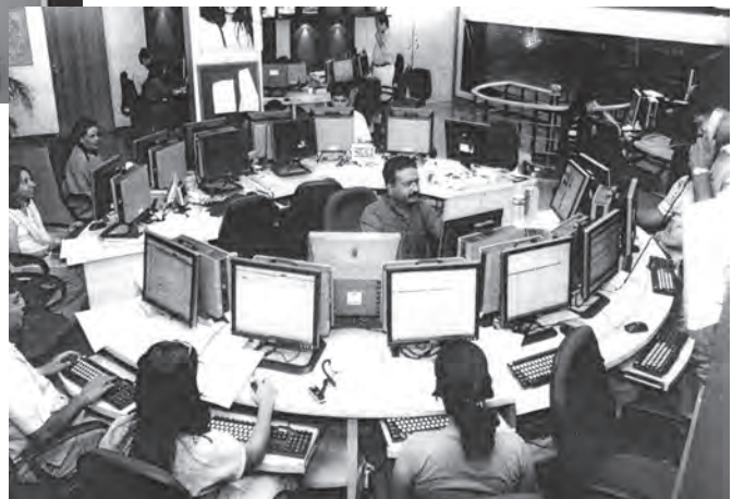
21वीं सदी का दूरदर्शन समाचार कक्ष, भारत

औद्योगिक क्रांति के साथ ही, मुद्रण उद्योग का भी विकास हुआ। कुलीन मुद्रणालय के प्रथम उत्पाद साक्षर अभिजात लोगों तक ही सीमित थे। तत्पश्चात् 19वीं सदी के मध्य भाग में आकर जब प्रौद्योगिकियों, परिवहन और साक्षरता में और आगे विकास हुआ, तभी समाचारपत्र जन-जन तक पहुँचने लगे। देश के विभिन्न क्षेत्रों में रहने वाले लोगों को एक जैसे समाचार पढ़ने या सुनने को मिलने लगे। ऐसा कहा जाता है कि इसी के फलस्वरूप देश के विभिन्न भागों में रहने वाले लोग परस्पर जुड़े हुए महसूस करने लगे और उनमें 'हम की भावना' विकसित