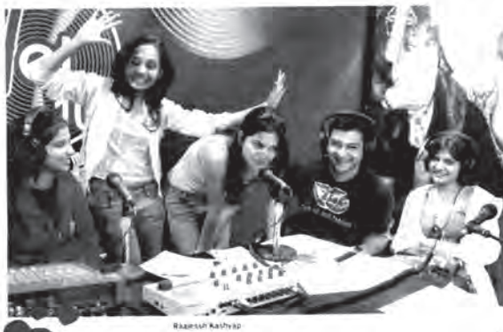
रेडियो गा गा

But what has made RJ-ing the coolest choice? Perhaps, it is the rising level of awareness among youngsters, who want something more and extraordinary when it comes to career. No fun of the mill stuff for them because they are willing to risk and experiment. As actress Preity Zinta, who was an RJ in